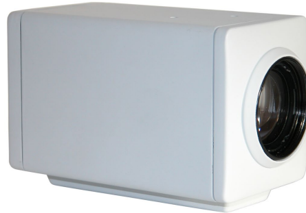
Capot et câblage pour caméra SD