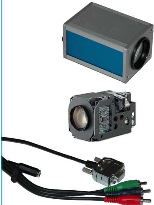
Capot et câblage pour caméra HD